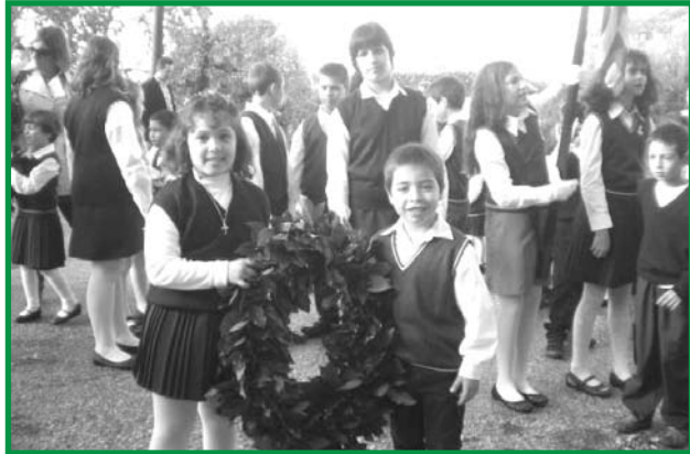
ΣΤΗΝ ΕΘΝΙΚΗ ΓΙΟΡΤΗ ΜΑΣ ΤΗΣ 28ης ΟΚΤΩΒΡΙΟΥ