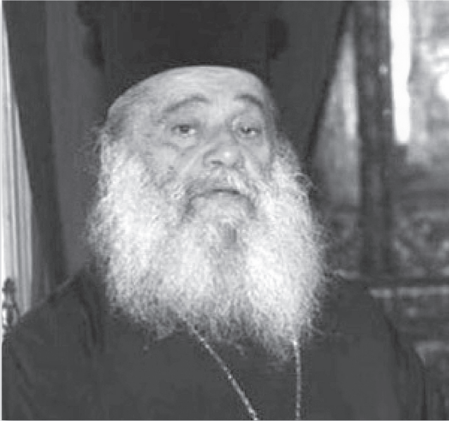
Α. Ο ΠΡΟΝΑΟΣ

αρχιμ. Χρυσστόμου Μαϊδώνη, Πρωτοσυγκέλλου Ιεράς Μητροπόλεως Ιερισσού, Αγίου Όρους & Αρδαμερίου